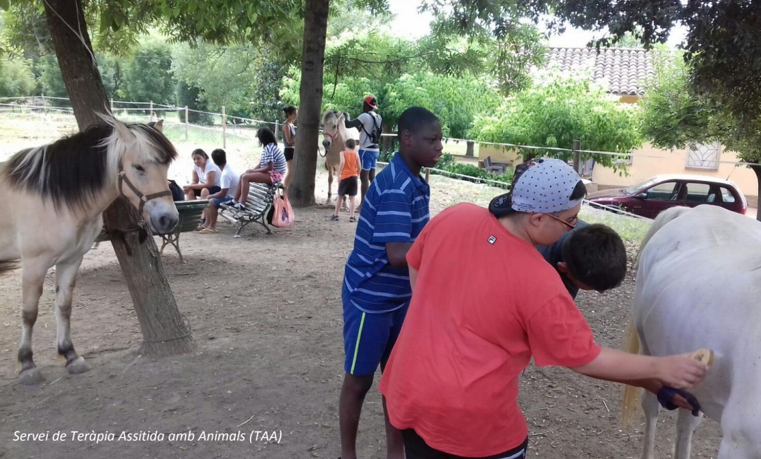
Servei de Teràpia Assitida amb Animals (TAA)