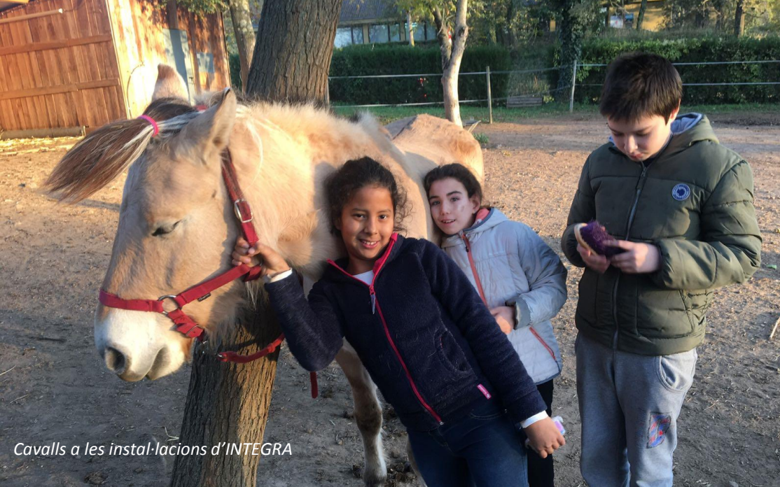
Cavalls a les instal·lacions d'INTEGRA